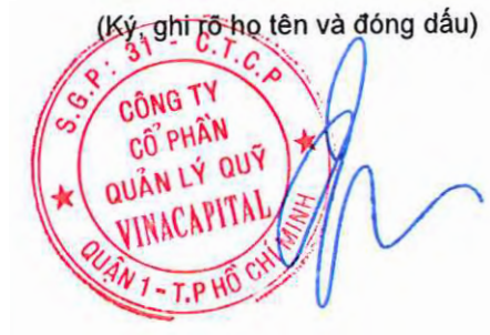
BROOK COLIN TAYLOR